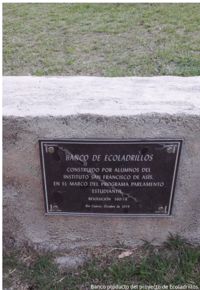
Banco producto del proyecto de Ecoladrillos.

jóvenes de la ciudad, "Frases Ciudadanas" pintadas por estudiantes en paredones de la ciudad que estén habilitados, Mural-Aniversario 130 años de la Escuela Superior Justo José de Urquiza, entre otros.