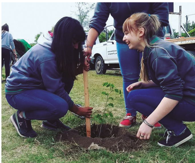
Alumnas del IPEM N° 28 reforestando en la ciclovía Reforma Universitaria.

El programa fue aprobado por el cuerpo legislativo de la ciudad de Río Cuarto a fines del 2016 y desde allí se comenzó a transitar un camino que, entre todos, pretendíamos construir.