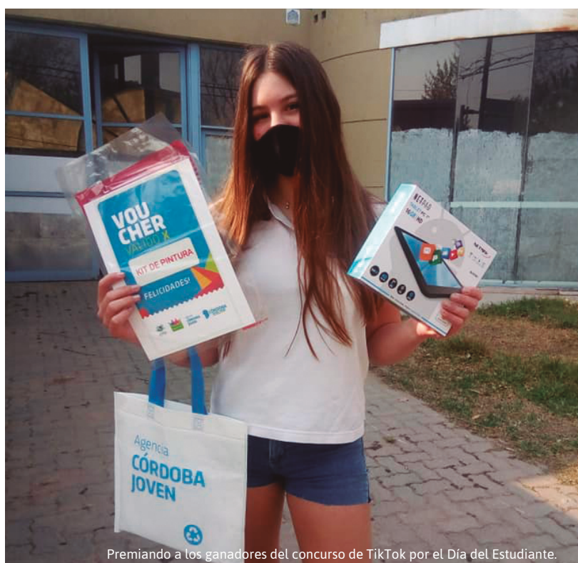
Premiando a los ganadores del concurso de TikTok por el Día del Estudiante.