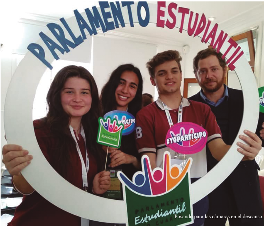
Posando para las cámaras en el descanso.