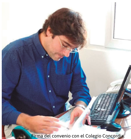
Firma del convenio con el Colegio Concordia.