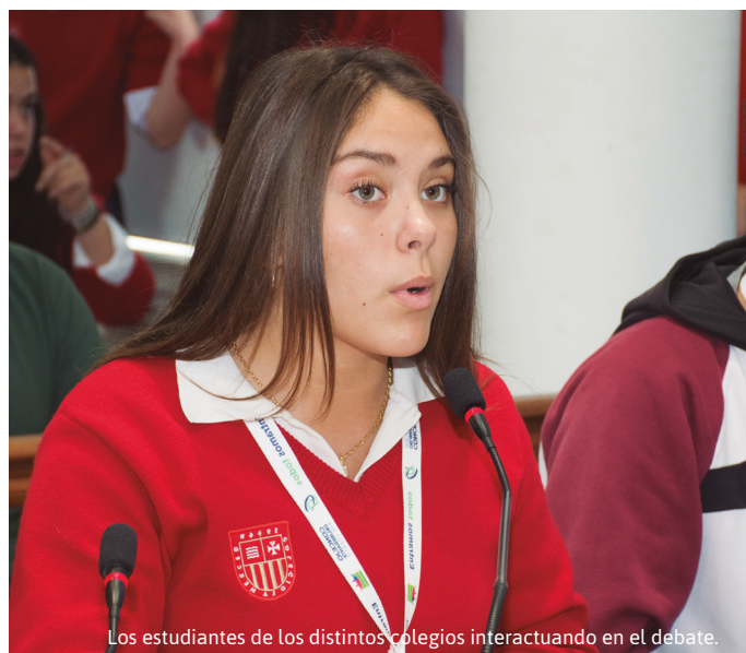
Los estudiantes de los distintos colegios interactuando en el debate.