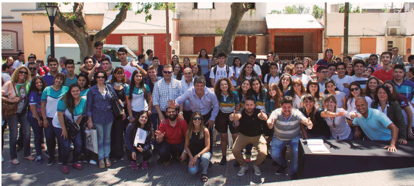
Cierre de ciclo 2018 en la plaza Juan Bautista Alberdi.