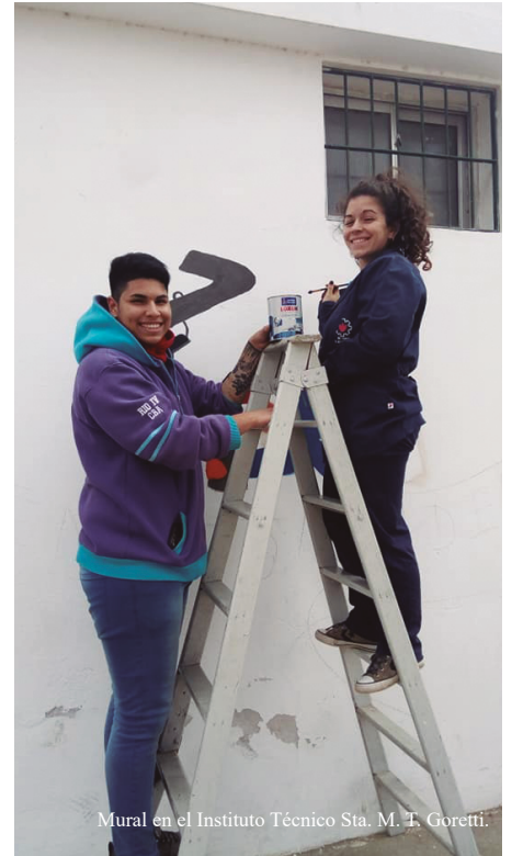
Mural en el Instituto Técnico Sta. M. T. Goretti.