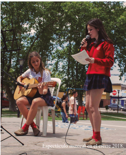
Espectáculo musical en el cierre 2018.