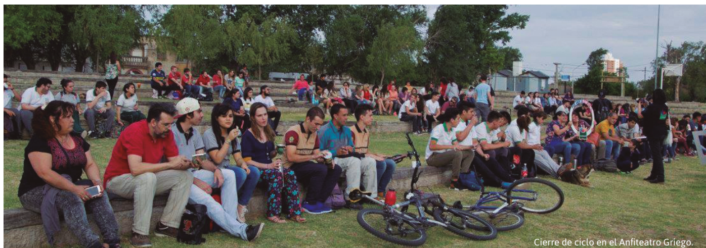
Cierre de ciclo en el Anfiteatro Griego.

14) Solicitud al departamento Ejecutivo Municipal y al Gobierno de la provincia de Córdoba la creación de un espacio en los márgenes del Río Chocancharava denominado "Costanera cultural y recreativa". 15) Modificación de la ordenanza N° 609/14 - Código de Espectáculos Públicos - en su artículo 39°. 16) Solicita la colaboración para la impresión de ejemplares de una revista elaborada por alumnos en el marco del proyecto "Comunicando lo que hacemos". 17) Celebración por el día de la "NO VIOLENCIA". 18) Autorización para la construcción de un Eco Parque de juegos en Avenida de las Américas en Barrio Malvinas. 19) Creación de un programa denominado "Fútbol inclusivo".