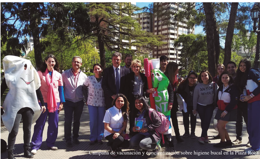
Campana de vacunación y concientización sobre higiene bucal en la Plaza Rocca.