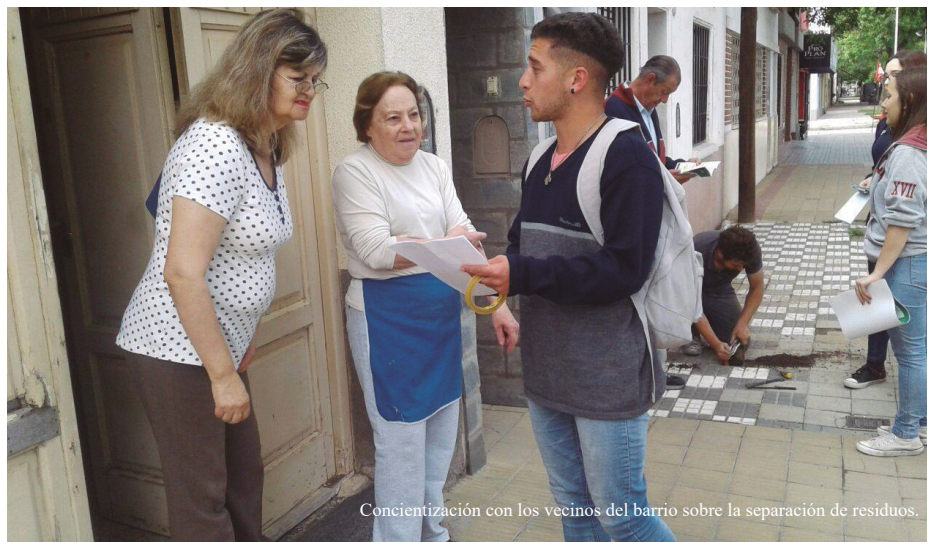
Concientización con los vecinos del barrio sobre la separación de residuos.