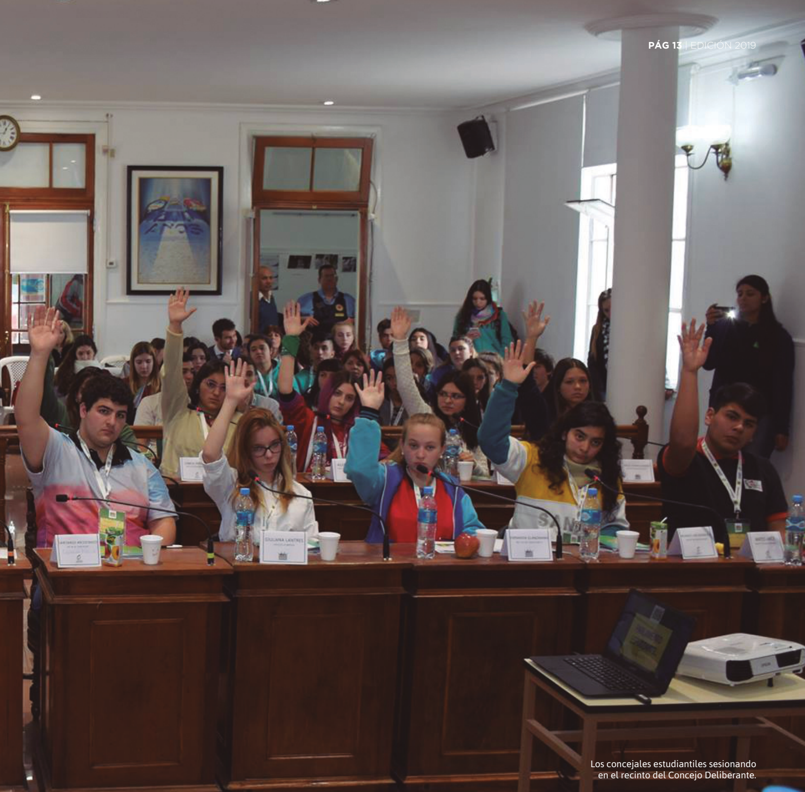
Los concejales estudiantiles sesionando en el recinto del Concejo Deliberante.

nos). 12) Plaza del Parlamento Estudiantil por la memoria. 13) Ed. Vial como estilo de vida. 14) Proyecto de ordenanza modificando el art. 5 y 6 de ordenanza N° 481/17 – Visitas de las escuelas a las industrias. 15) Cuerpo, mente y vínculos a la obra! 16) Aprendamos Juntos. 17) Por una feliz, esperanza ciudadana. 18) Derecho a la seguridad. 19) INTERconectados: adquiriendo conocimientos.