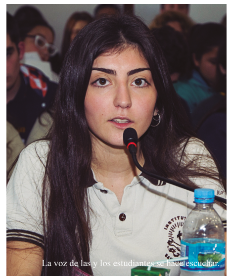
La voz de las y los estudiantes se hace escuchar.