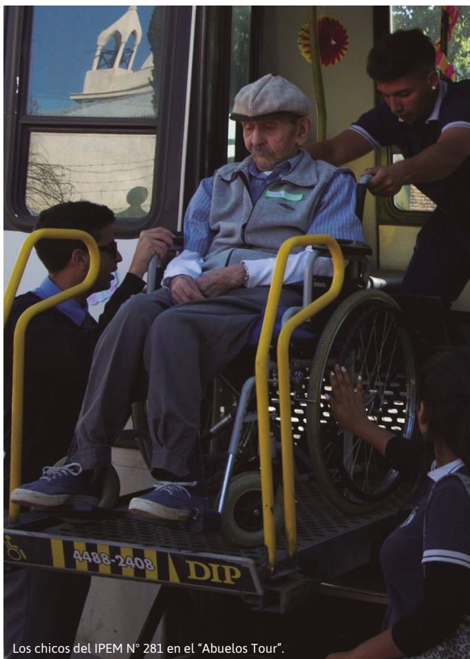
Los chicos del IPEM N° 281 en el "Abuelos Tour".

1) Cursos de capacitación de informática. 2) Creación de aplicación para dispositivo móvil. 3) Implementación de micrositio web con información de todas las instituciones educativas de nivel medio. 4) Promoción de políticas y programas integrales de acuerdo con la Carta Orgánica Municipal, artículo N° 45. 5) Creación de aplicación llamada "Centro de comunicación virtual: "Reclame Ya". 6) Programa "Unidos en Tic, somos". 7) Implementación del programa "Periodismo estudiantil". 8) Realización de "Jornadas de puertas abiertas (JEPA) para el uso, acceso y control de las TIC". 9) Creación de una agenda cultural digital para Río Cuarto. 10) Plataforma digital: material educativo de los distintos centros educativos del nivel medio. 11) Portal Municipal de organizaciones no gubernamentales. 12) Acceso desde la página web oficial de la municipalidad de Río Cuarto a información y actividades para jóvenes. 13) Seminarios sobre la desmotivación de adicciones y automedicación. 14) Aplicación: "Miriocuarto", espacio digital con información y noticias para todos los ciudadanos. 15) Programa: "Un minuto en tu lugar". 16) Implementación de tecnologías de la información para brindar apoyo escolar en centros comunitarios. 17) Aplicación para dispositivo móvil con información sobre medio ambiente e higiene de la ciudad de Río Cuarto. 18) "Retrocompatibilidad social". 19) Campaña sobre vacunación e higiene bucal.