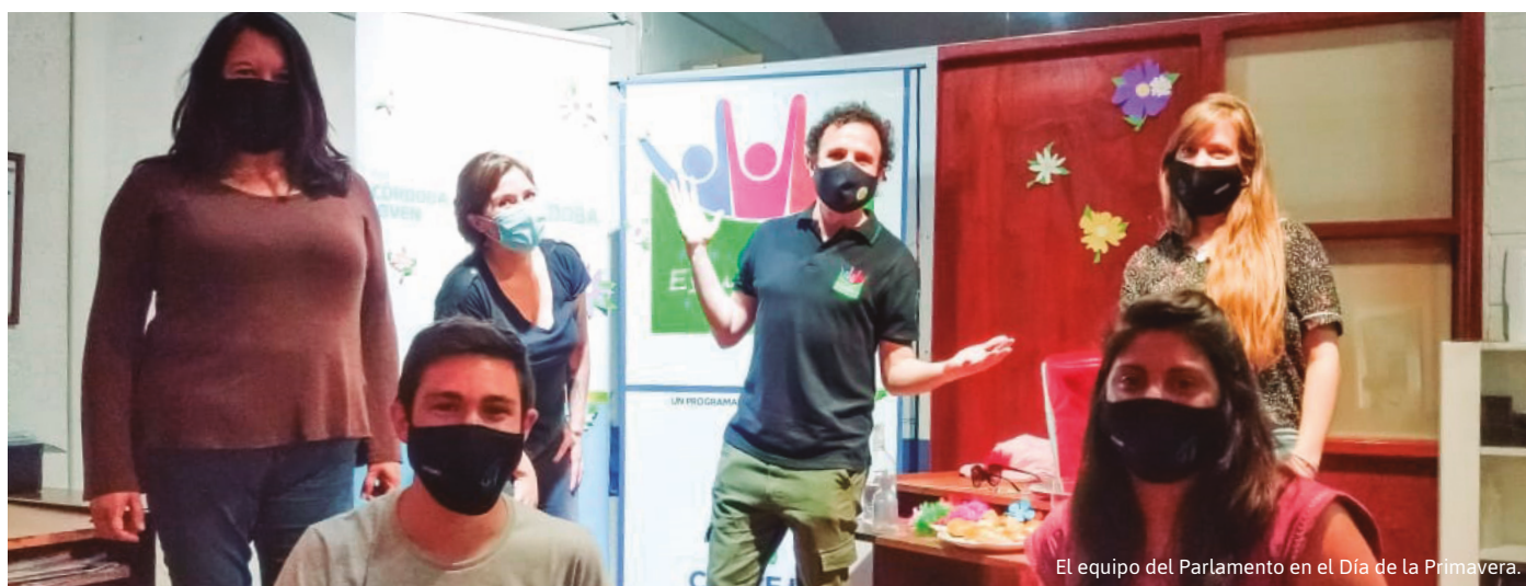
El equipo del Parlamento en el Día de la Primavera.