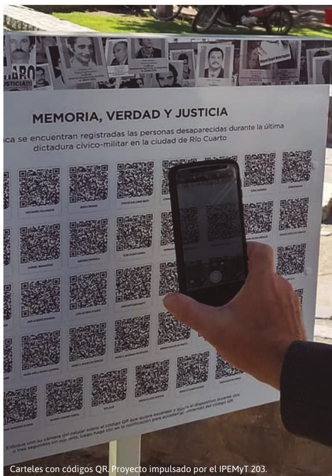
Carteles con códigos QR. Proyecto impulsado por el IPEMyT 203.

Sobre el final del año y como cierre de la edición, al igual que los años anteriores, reuniéndonos en un punto de encuentro, Parque del Centro Cívico de la ciudad, para presenciar la entrega de certificados de participación en el programa, disfrutar de la música en vivo y fortalecer vínculos entre los alumnos y alumnas de las diferentes instituciones.