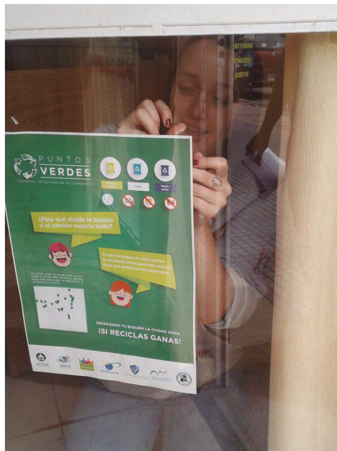
Promoviendo los "Puntos Verdes" de la ciudad.

14) Solicitud al departamento Ejecutivo Municipal y al Gobierno de la provincia de Córdoba la creación de un espacio en los márgenes del Río Chocancharava denominado "Costanera cultural y recreativa". 15) Modificación de la ordenanza N° 609/14 - Código de Espectáculos Públicos - en su artículo 39°. 16) Solicita la colaboración para la impresión de ejemplares de una revista elaborada por alumnos en el marco del proyecto "Comunicando lo que hacemos". 17) Celebración por el día de la "NO VIOLENCIA". 18) Autorización para la construcción de un Eco Parque de juegos en Avenida de las Américas en Barrio Malvinas. 19) Creación de un programa denominado "Fútbol inclusivo".